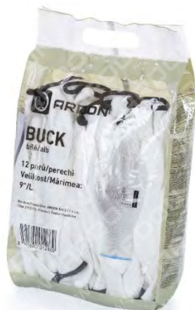
RETAIL PACK OBRAZ